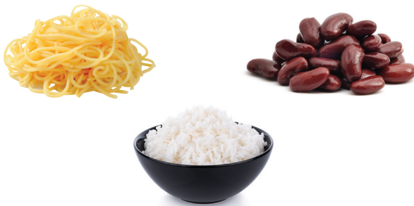
Mga Pasta, Mga Butil, Kanin at Sitaw