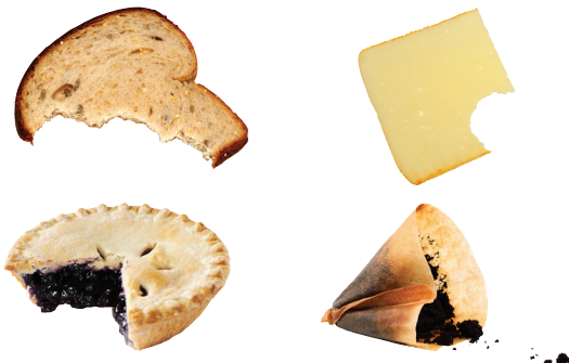
Tinapay, Giniling na Kape at Mga Filter, Keso at Mga Pastelerya