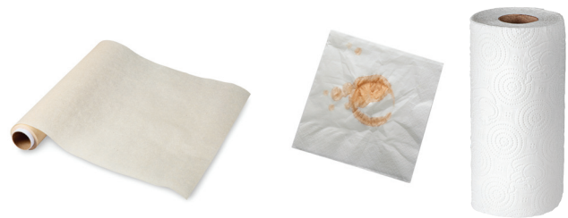
Pergaminong Papel na Nadumihan ng Pagkain, Mga Tuwalyang Papel sa Kusina at Mga Serbilyeta