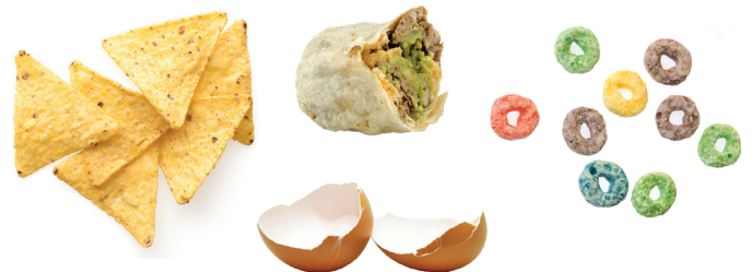
Hindi Nakakaing Tirang Pagkain, Mga Itlog at Mga Kabibi