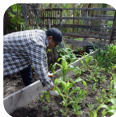
Mở Rộng Cơ Hội Kinh Tế