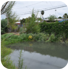
Khôi Phục Môi Trường Sống Sinh Thái