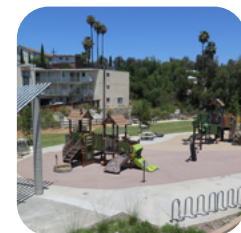
Thúc Đẩy Sự Phát Triển Mới Gắn Kết

Quy Hoạch Tổng Thể Chollas Creek sẽ là tài liệu quy hoạch dài hạn do Thành phố San Diego phát triển với sự hợp tác của nhiều bên liên quan và thành viên cộng đồng nhằm định hướng tương lai bền vững của Lưu vực suối Chollas Creek trong vai trò là một công viên khu vực. Mục tiêu của Quy Hoạch Tổng Thể là bảo vệ và nâng cao hệ sinh thái của Lưu vực suối Chollas Creek; cải thiện tính bền vững và khả năng phục hồi của lưu vực suối trước tác động của biến đổi khí hậu; tăng cơ hội giải trí; cải thiện việc đi dạo bộ/đẩy xe và đạp xe trong lưu vực suối và các vùng lân cận; và nuôi dưỡng ý thức giữ gìn và kết nối với Chollas Creek cùng các thành viên cộng đồng.