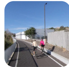
Giảm Lượng Khí Thải Nhà Kính