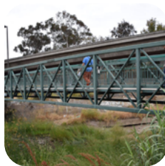
Khuyến Khích Người Đi Bộ