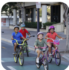
Cải Thiện Sức Khỏe Cộng Đồng