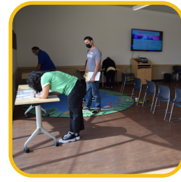
Realizar un análisis del mapeo y de las deficiencias.