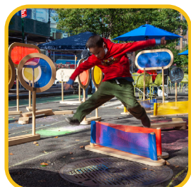
De implementación rápida