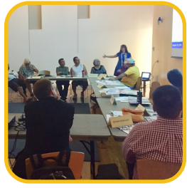
Identificar casos prácticos.