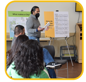
Crear el marco operativo para procesos simplificados.