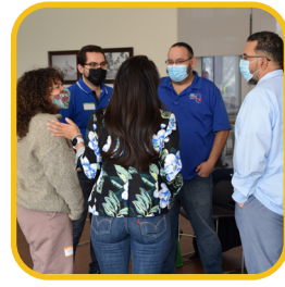
Entrevistar a las partes interesadas.