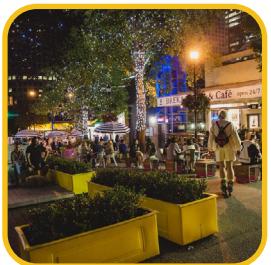
Representativos de las necesidades y los deseos de la comunidad