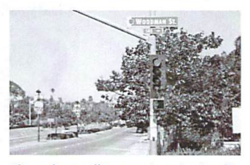
Please observe all construction-related traffic signs and temporary lane closures in the vicinity of Woodman Street and Imperial Avenue during the one-year project.

working hours due to unforeseen circumstances. Residents and stakeholders will be promptly notified of construction schedule updates via door hangers.