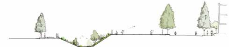
Northwest Residential/ Walgreen's Site Section