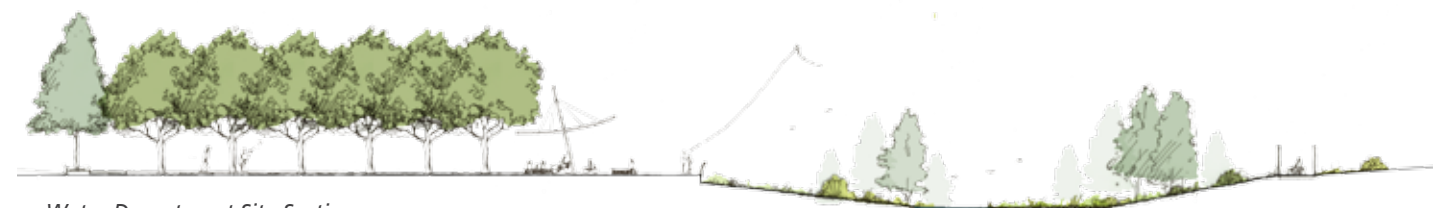
Water Department Site Section