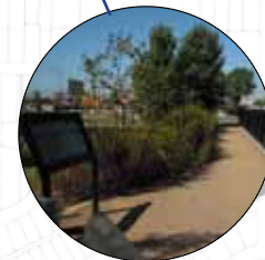
North Market Street Pathway (Completed)