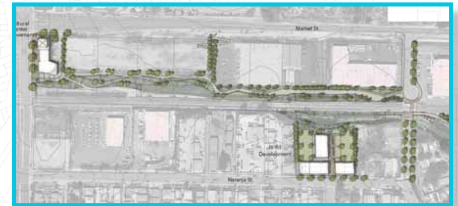
Phase I: Segment 2A: North Market St. Pathway