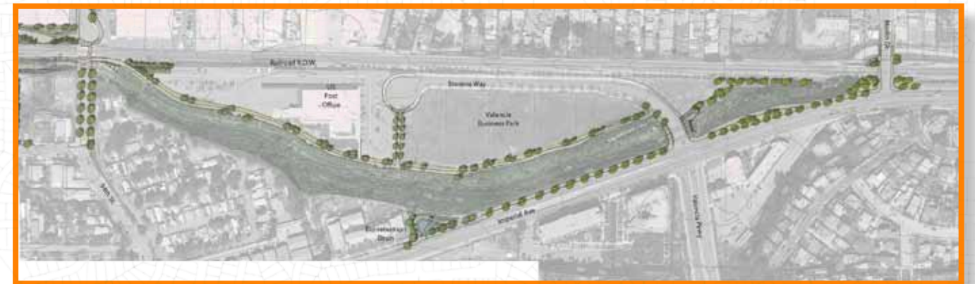
Phase II: Valencia Business Park