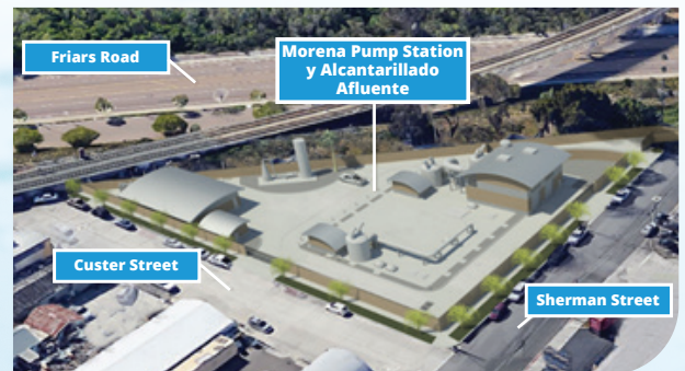
| Representación de Morena Pump Station