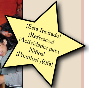
Children are Welcome!