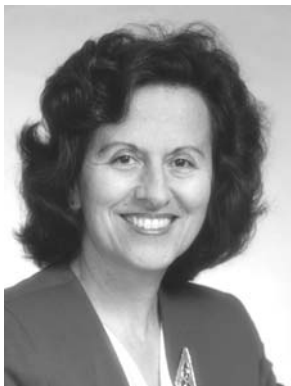
PAT ZAHAROPOULOS Tagausig na Abugado ng Estado